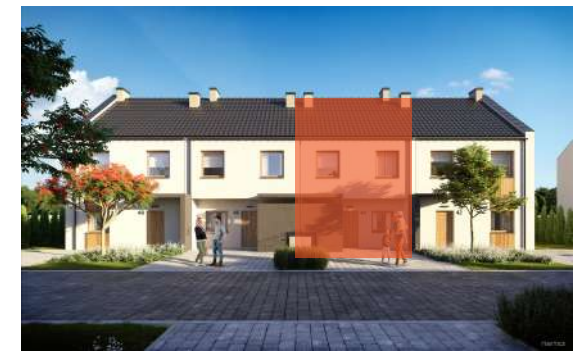
Widok od frontu budynku