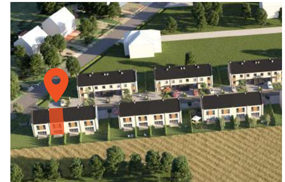
Rzut osiedla - zagospodarowanie osiedla