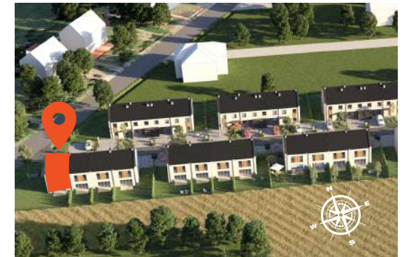
Rzut osiedla - zagospodarowanie osiedla