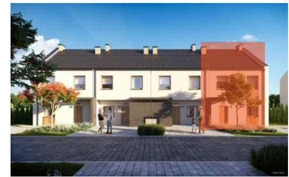
Widok od frontu budynku